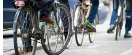
Ontdek Antwerpen met de fiets! p.3