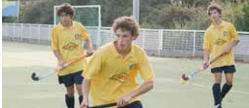
Tophockey op Wilrijkse Pleinen p.2