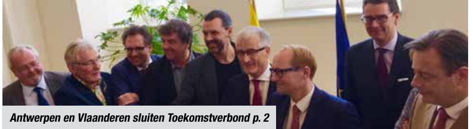
Antwerpen en Vlaanderen sluiten Toekomstverbond p. 2